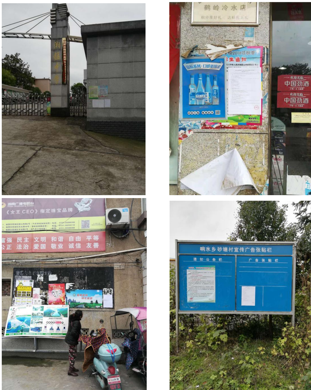
图 4 张贴公告公示截图