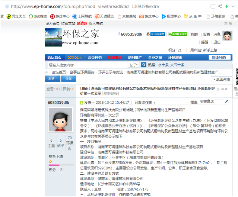
图 1 网络公示截图

本项目于 2018 年 10 月 12 日在环保之家网站（属于《办法》中的载体）上进行了环境信息公开与环评报告公示（ http://www.ep-home.com/forum.php?mod=viewthread&tid=110919&extra= ），向公众公告项目的环境影响信息，征求广泛群众的意见。